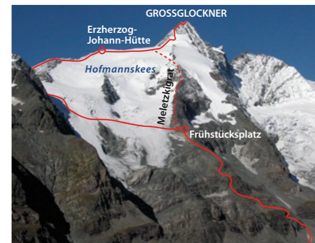
Aufstiegsrouten von Heiligenblut Glockner-Nordseite

Auf den Großglockner führen - mit Varianten - rund 30 Routen. Mehr als 90 Prozent aller Besteigungen erfolgen in den Sommermonaten von der Salmhütte und Stüdlhütte über den Normalweg auf die Erzherzog-Johann-Hütte und von dort aus über das Glocknerleitl auf den Gipfel. Sehr beliebt ist auch der Anstieg von der Stüdlhütte über den Stüdlgrat , der direkt auf den Großglockner führt.