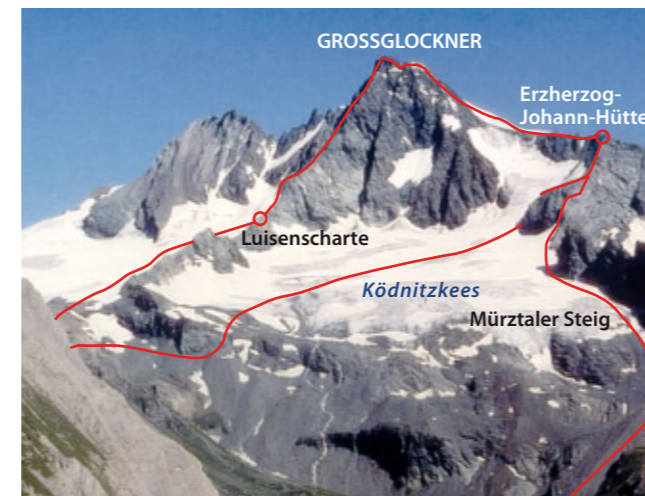
Aufstiegsrouten von Kals Glockner-Südseite

Von den „Bergsteigerdörfern“ Heiligenblut und Kals a. G. führen die Hauptaufstiegsrouten zur Erzherzog-Johann-Hütte (3.454 m) auf der Adlersruhe. Eine Besteigung des Großglockners ist als 2-Tagestour zu empfehlen!