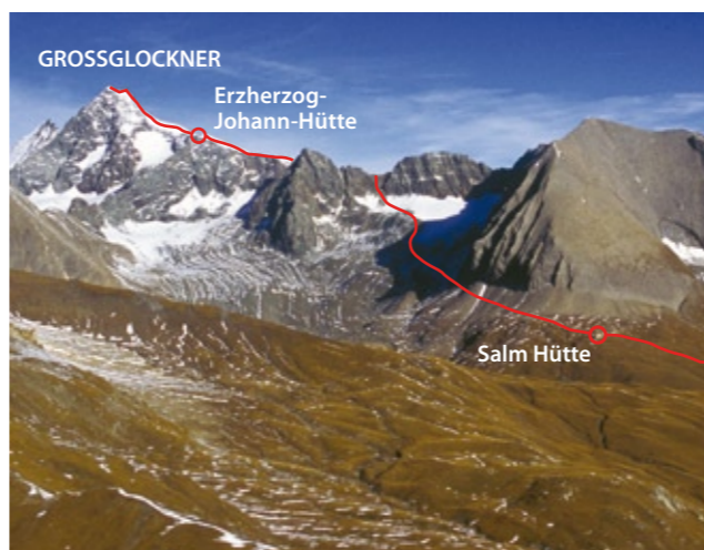
Aufstiegsroute von der Salmhütte über die Hohenwartscharte

➔ Von Heiligenblut über die Mautstraße auf die Franz-Josefs-Höhe; über den Gletscherweg Pasterze (Gletscherbahn) zur Pasterze hinab; nach Überquerung des Gletschers steil hinauf zum „Frühstücksplatz“ (2.793 m); weiter über das spaltenreiche Hofmannskees zum Salmkamp und zur Erzherzog-Johann-Hütte auf der Adlersruhe (5 Stunden). Alternativ vom „Frühstücksplatz“ über Glocknerkarkamp (= „Meletzkgigrat“; II. Schwierigkeitsgrad).